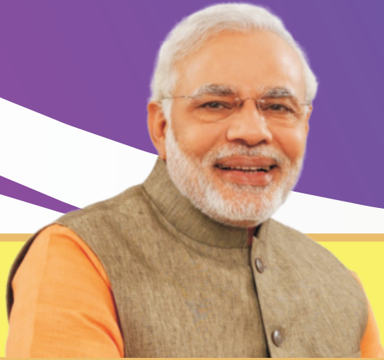
Narendra Modi Prime Minister