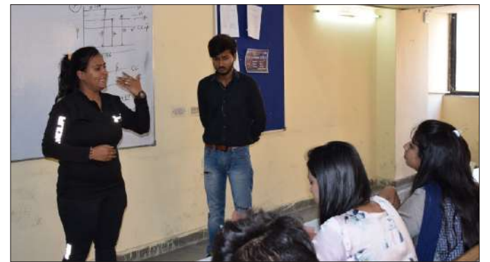
During Competition Participant Presenting her Business Plan