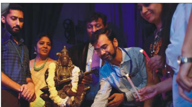
दीप प्रज्ज्वलन करते हुए अतिथि गण