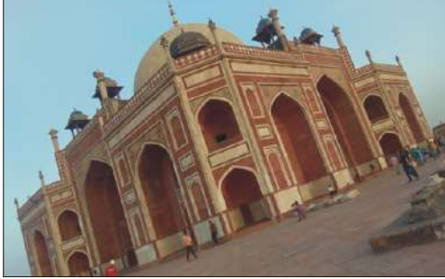
A photograph using canted angle