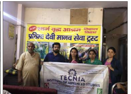
ओल्ड ऐज होम विजिट के दौरान टेक्निया के छात्र-छात्राएं