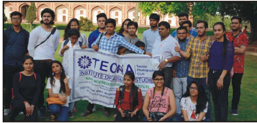
Students with the banner of Tecnia Photography Club during RUBARU 2019 - Photowalk on Monumental Photography at Humayun's Tomb

Tecnia Institute of Advanced Studies organized a Photowalk for the students of Tecnia Photography Club and BA(J&MC) at Humayun's Tomb, Mathura Road Opposite Dargah, Nizamuddin, New Delhi; to have an experience of Monumental Photography under the banner RUBARU 2019. All the 21 Students of BA(J&MC) participated in the photowalk on Monumental Photography at Humayun's Tomb learnt the working of still cameras, Nikon D-5300; Canon-1300 D; Sony Alpha 6000 Mirrorless Digital Camera; Canon 1500D; Canon 1200D Canon 1000D..The students learnt how to play with light during the photowalk? How to use Happy hours (4-6 pm) for photography because the brightness of the sun is less and the photographs do not become white (with more contrast).The students learnt to use their skills of imagination for taking the photographs. They took the photos of the shadow of the monument in the water. They took photographs using the provided props like trees. The students learnt to use the skills angles and designs during the photowalk as they used canted or dutch angle for the coverage of the monument which was not possible in the frame with landscape or portrait view. They took photographs to show various designs used in the monument such as radial designs. After the program the students were involved in the group photographs Session.