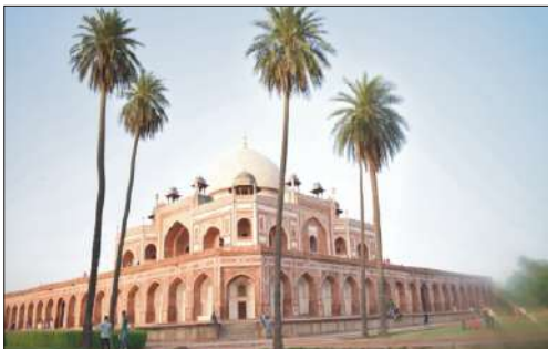
Student's Photograph using their imagination