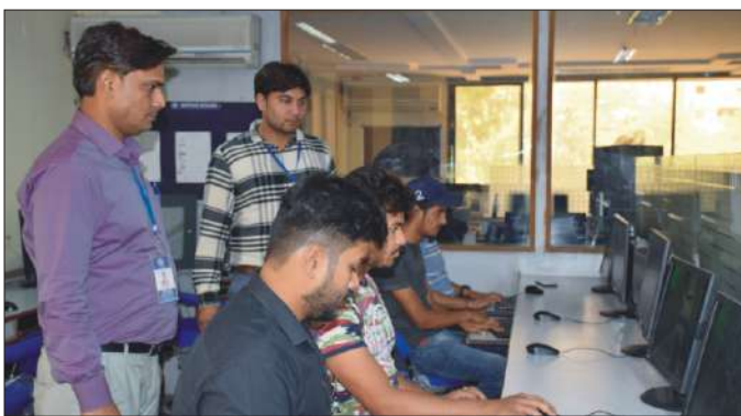
प्रतिभाषी प्रोडक्ट लोगो डिजाइन करते हुए