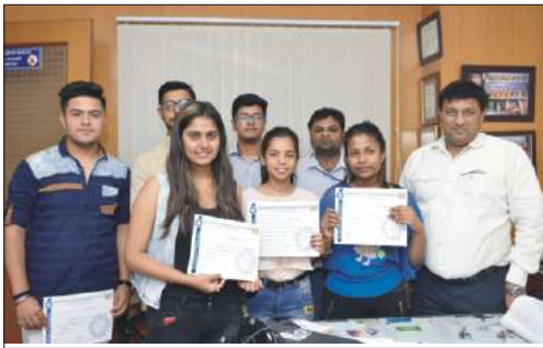
Group Photograph after the certificate distributio RUBARU 2019 - Photowalk on Monumental Photography