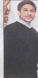
Maneka Gandhi a

The Lounge Journals, a national initiative by Café Coffee Day was introduced last week at the Café Coffee Day Lounge at Connaught Place by actor Poorna Jagannathan of Delhi Belly fame. The Lounge Journals is a series of talk sessions with celebrity experts on hobbies, topics and passions of the youth. Jagannathan shared her experiences and knowledge of the various facets of acting.