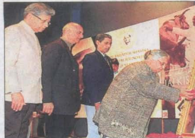
Chief minister Sheila Dikshit paying tribute to Lal Bahadur

Well Experienced Manufacturing Chemists In Paints, adhesives, Inks, Foundry Chemicals, Lubricants, Greases, Pretreatment, Chemicals, Insulating Varnishes, Bird Chemicals, Any Specialized Item Can Make Independently For Our Gurgaon/Sohna Factories. Apply Urgently. E-mail:- har_chem@rediffmail.com