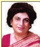
Prof. Kiran Walia Hon'ble Minister of Social Welfare, Delhi