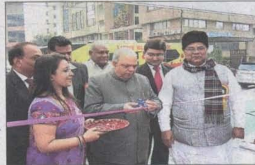
A seminar was organised by Akhil Bhartiya Vaish Maha Sammelan at Tecnia Institute, Rohini.

A two-day international seminar was organised jointly by Akhil Bhartiya Vaish Maha Sammelan and Tecnia Institute of Advanced Studies (TIAS), on the topic, disability is a challenge - its opportunities in education and employment. The meet concluded amidst colourful cultural programmes presented by the differently-abled from across of country. Haryana governor Jagannath Pahadia was the chief guest on the occasion.