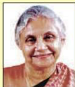
Smt. Sheila Dikshit Hon'ble Chief Minister, Delhi